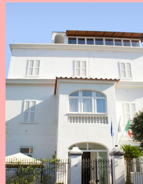
IL NOSTRO RESIDENCE IN CORSO LUIGI MANZI 12 (80074 CASAMICCIOLA TERME, ISCHIA)